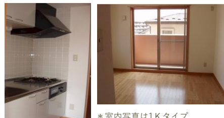
*室内写真は1Kタイプ