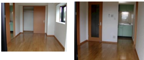
※室内写真は3号室タイプとなります。

家具家電付でも 家賃管理費 そのまんま!! 希望に応じて 家具家電 セットできます!!