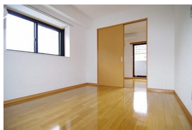
※室内写真は2号室となります。

日本ホームの TurnKey ターンキー マンション トリプルゼロ MANSION