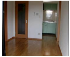
※室内写真は3号室タイプとなります。

※退去・入居時期はあくまで予定となります。 変更となる場合がございます事、予めご了承願います。