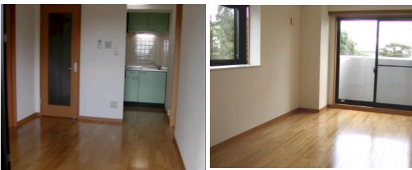
※室内写真は3号室タイプとなります。

日本ホームの TurnKey ターンキー マンション トリプルゼロ MANSION