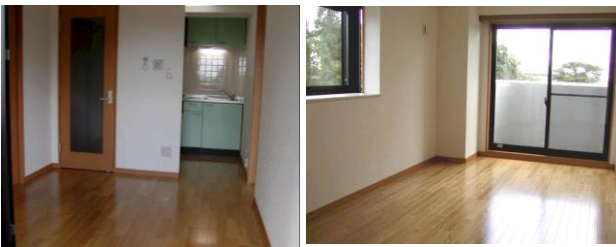
※室内写真は3号室タイプとなります。