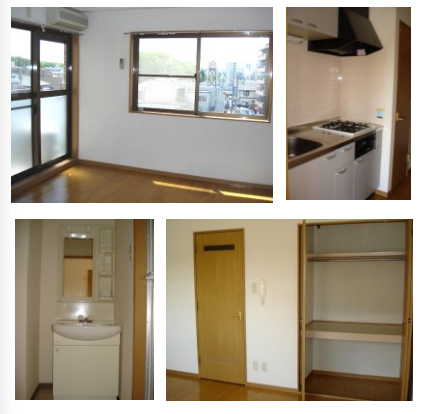
※室内写真は401号室となります。

301号室 退去予定 家賃 53,000円 管理費 3,000円 メンテ保証料 600円 (緊急メンテ含む) (5/未退去予定・ 6/中旬入居可予定) 使用部分面積：27.36㎡