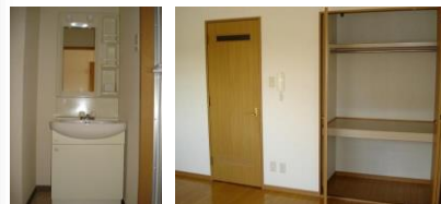
※室内写真は401号室となります。