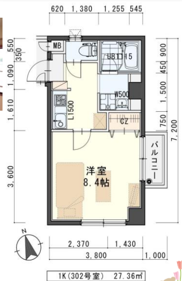
※現況と図面が異なる場合は現況優先