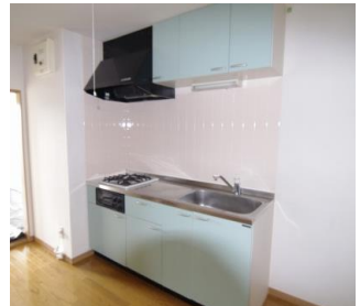
※室内写真は301号室となります。

今回募集 501号室 退去予定 家賃：69,000円 管理費：3,000円 メンテ保証料：600円 (緊急修理含む) (9/末退去予定・10/中旬入居可予定) 使用部分面積：53.55㎡