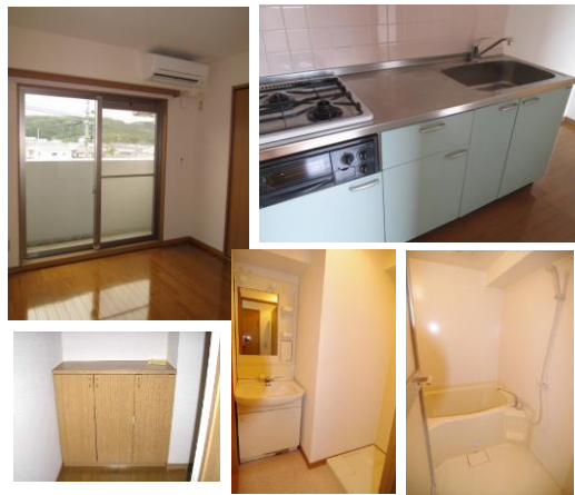
※室内写真は6号室(トイレ、洗面所は5号室)となります。