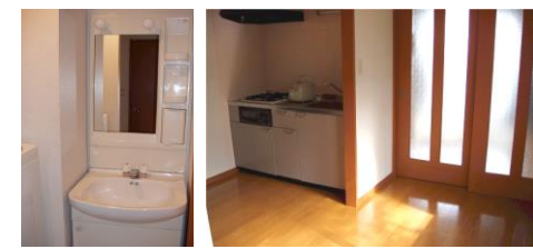
※写真は反転タイプ