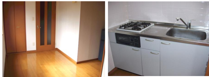
※写真は2号室タイプ