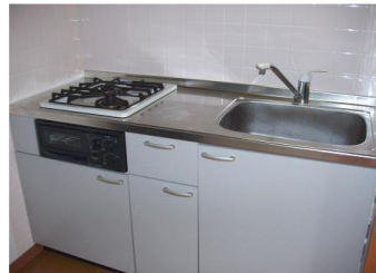
1DK (305号室) 31.50㎡