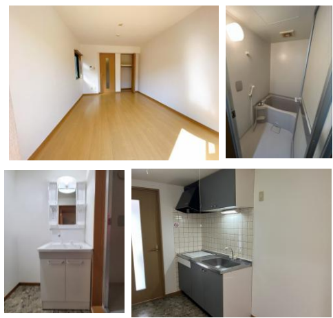
※室内写真は101号室となります。

東北大学 川内キャンパス・星陵キャンパスへ 通学 便利な立地です。 原付・自転車駐輪可能です!