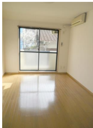
※室内写真は105号室となります。