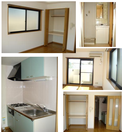
※室内写真は1号室77(反転となります)