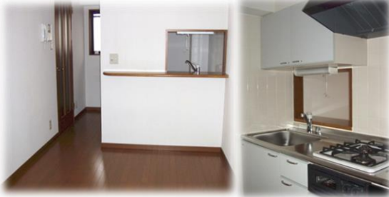
※室内写真は1DKタイプとなります。