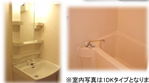
※室内写真は1DKタイプとなります