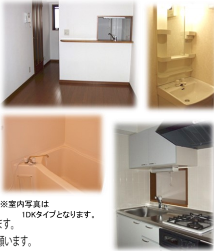
※室内写真は1DKタイプとなります。

302号室 退去済 家賃 56,000円 管理費 3,500円 メンテ保証料 600円 (緊急メンテ含む) (即入居可) 使用部分面積: 32.25㎡