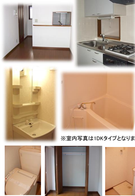
※室内写真は1DKタイプとなります