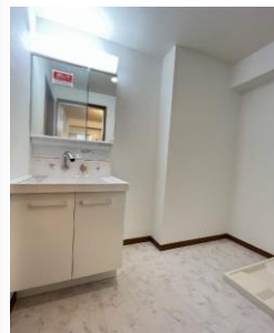
※室内写真は501号室となります。