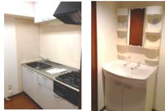
※室内写真は202号室となります。