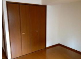
※室内写真は1号室となります。