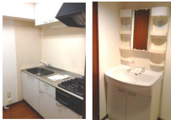
※室内写真は202号室となります。