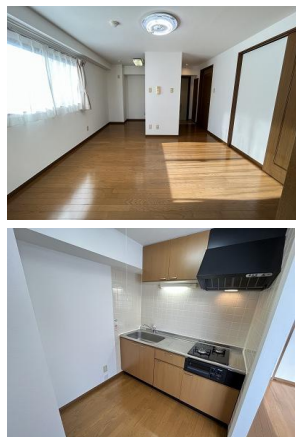
※室内写真は802号室となります。

802号室 退去済 家賃 90,000円 管理費 5,000円 緊急メンテ費 700円