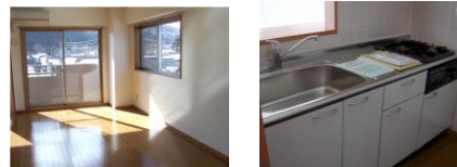
※室内写真は5号室タイプとなります。

505号室 退去予定 家賃：69,000円 管理費：3,500円 償却負担金：880円 (2/未退去予定・3/中旬入居可予定) 使用部分面積：53.55㎡