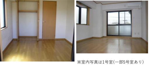
※室内写真は1号室(一部5号室あり)