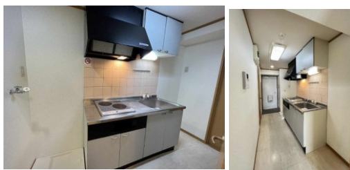
※室内写真は201号室のため反転となります。