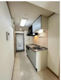
※室内写真は201号室となります。