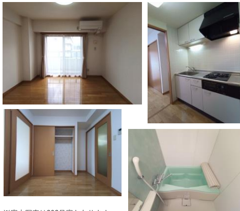
※室内写真は302号室となります。

202号室 賃料：60,000円 管理費：4,000円 緊急メンテ費：700円 (リフォーム中・ 4/中旬入居可予定) 使用部分面積：30.15㎡