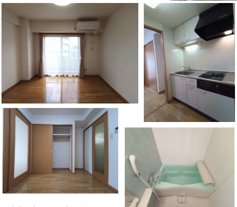
※室内写真は302号室となります。