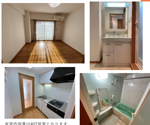
※室内写真は402号室となります。

退去済 402号室 賃料：58,000円 管理費：4,000円 緊急メンテ費：700円 (即入居可) 使用部分面積：30.15㎡