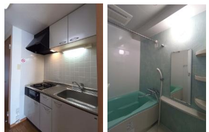
※室内写真は601号室となります。

地下鉄南北線「北四番丁」駅 1.6km 徒歩 20分 地下鉄東西線「川内」駅 1.8km 徒歩 23分 「国際センター」駅 1.5km 徒歩 19分 西友八幡町店・八幡町郵便局 50m 徒歩 1分 レキシントプラザ 140m 徒歩 2分 ・みやぎ生協八幡町店 ・Can★Do ・クリニック ・飲食店など 東北大学病院 1.0km 徒歩 13分 七十七銀行八幡町支店 80m 徒歩 1分 八幡交番 80m 徒歩 1分 東北大学皇陵キャンパス 医学部入口 700m 徒歩 9分 東北大学川内キャンパス 1.8km 徒歩 23分