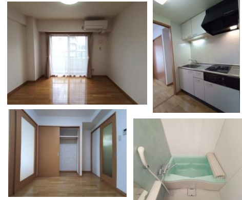
※室内写真は302号室のため反転となります。