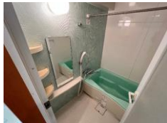
※室内写真は202号室となります。