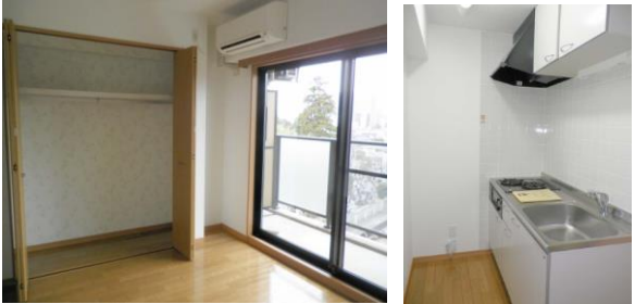
※室内写真は 602号室のため反転となります。

今回募集 203号室 退去済 家賃 61,000円 管理費 4,000円 メンテ保証料 600円 (緊急修理含む)