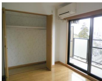
※室内写真は 602号室となります。