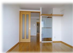
※室内写真は503号室となります。