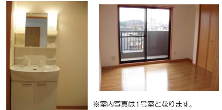
※室内写真は1号室となります。

退去予定 301号室 賃料：55,000円 管理費：3,000円 メンテ保証料：600円 (緊急修理含む) (1/末退去予定・2/中旬入居可予定) 使用部分面積：33.30㎡