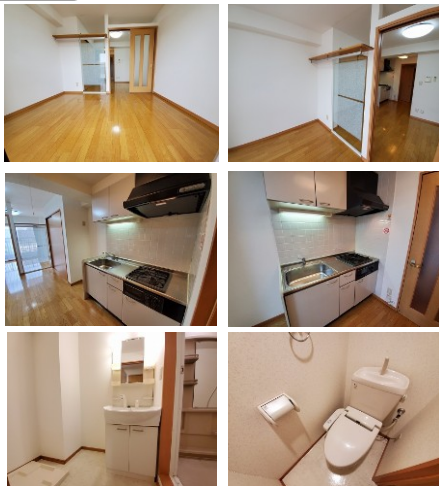
※室内写真は302号室となります。

退去済 602号室 賃料: 54,000円 管理費: 3,000円 緊急メンテ費: 700円 (即入居可) 使用部分面積: 28.80㎡