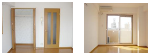
*室内写真は、305号室となります*