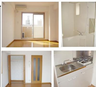
*室内写真は、305号室となります