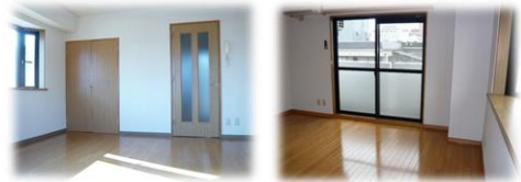
※室内写真は1号室のため反転となります。 (出窓はありません)