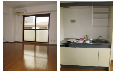
※室内写真は203号室となります。

今回募集 603号室 退去済 家賃：58,000円 管理費：4,000円 メンテ保証料：600円 (緊急メンテ含む) (リフォーム中・ 4/末入居可予定) 使用部分面積：24.96㎡