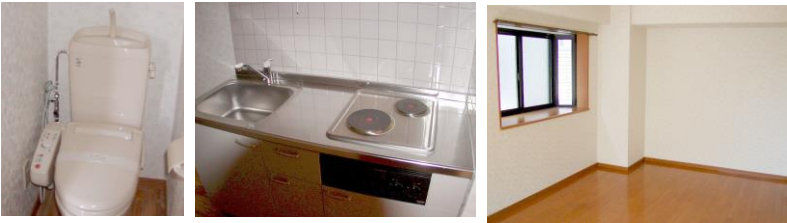
※室内写真は1号室のため、参考資料としてご利用下 ※現況と図面が異なる場合は現況優先

*今回募集* 302号室 退去済 家賃: 54,000円 管理費: 4,000円 メンテ保証料: 600円 (緊急修理含む) (即入居可) 使用部分面積: 28.19㎡