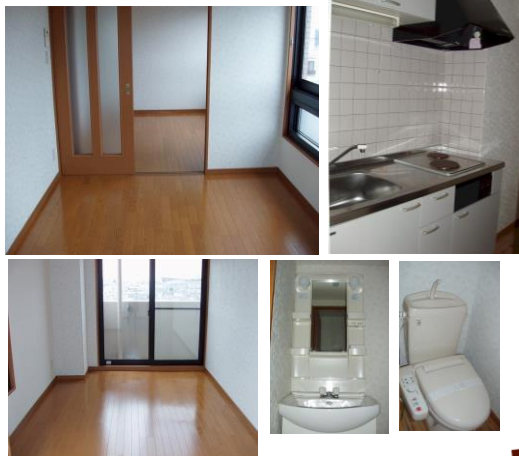
※室内写真は3号室となります。