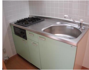
※室内写真は3号室となります。