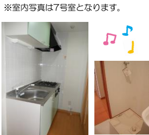
※室内写真は7号室となります。

退去予定 207号室 家賃：55,000円 管理費：3,500円 メンテ保証料：600円 (緊急修理含む) (2/末退去予定・3/中旬入居可予定) 使用部分面積：27.13㎡