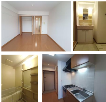
*室内写真は502号室となります。

今回募集 302号室 退去済 家賃 56,000円 管理費 4,500円 緊急メンテナンス費 700円 (即入居可) 使用部分面積: 26.24㎡