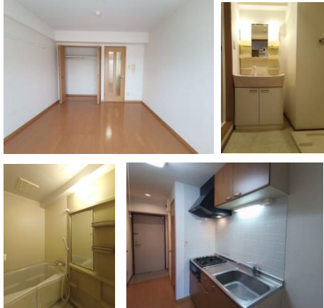
*室内写真は502号室の為反転となります。

今回募集 303号室 退去済 家賃 56,000円 管理費 4,500円 メンテ保証料 600円 (緊急メンテ含む) (即入居可) 使用部分面積: 26.24㎡