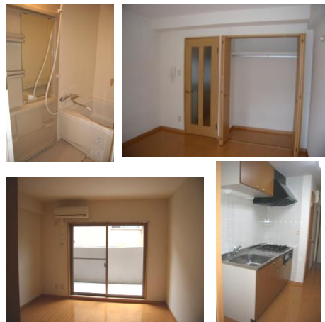
*室内写真は106号室のため、反転となります。