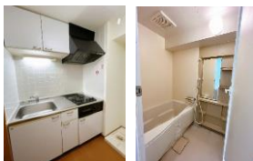
※室内写真は506号室となります。