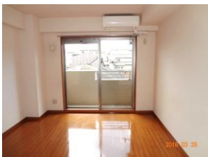
※室内写真は303号室となります。