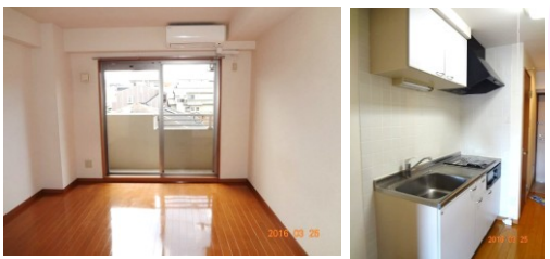
※室内写真は303号室となります。